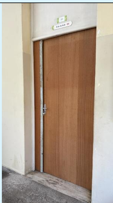
Bloco A. Substituição da Porta da Sala 5