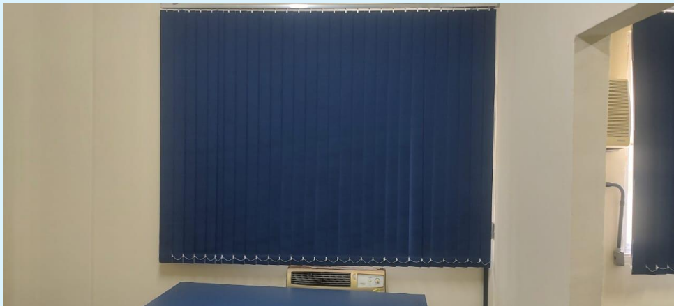
Bloco A - Instalação de Cortinas no novo Espaço do DAJUP