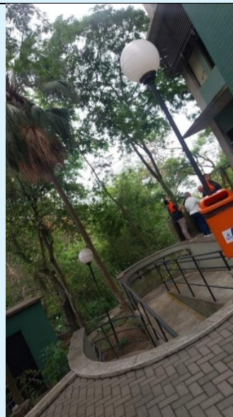
Bloco E - Deslocamentos na fachada lateral do Bloco E do Instituto Biomédico em 23 e 24 de outubro de 2024 Área encontra-se interditada e Técnicos da Defesa Civil garantiram a segurança da edificação.