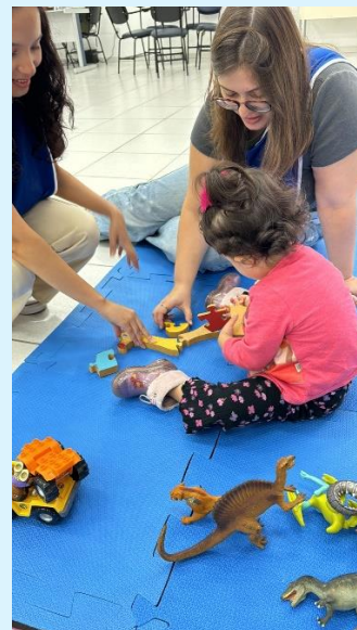
Bloco C – Espaço Kids de apoio a Semana de Monitoria do CMB oferecido pela Direção do Biomédico