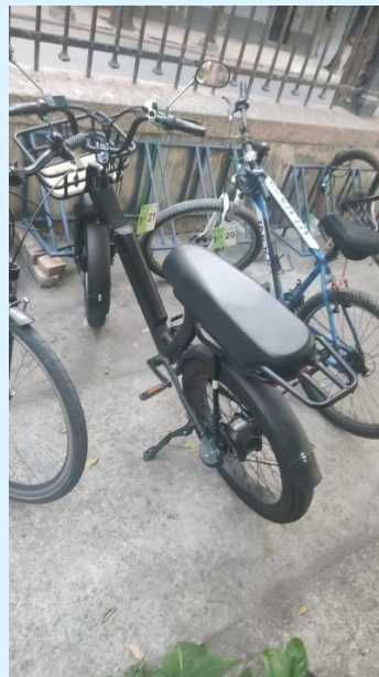
Bloco A – Imagem dos novos modelos de bicicletas no estacionamento do Instituto Biomédico, para as quais será necessário apresentação pelo usuário de um Termo Especial de Autorização