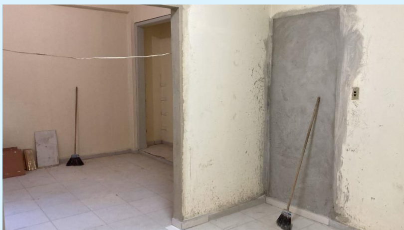
Andamento da Obra do Diretório do Bloco A