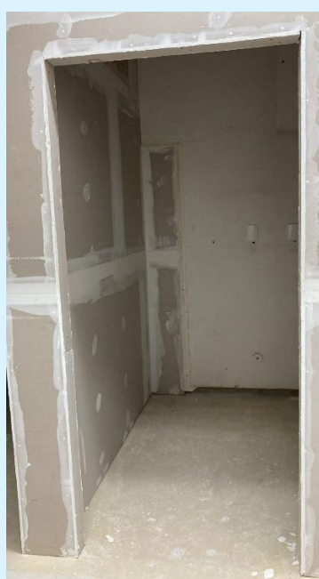
Andamento da Obra de instalação do Biotério do MIP na sala 311 do Bloco A