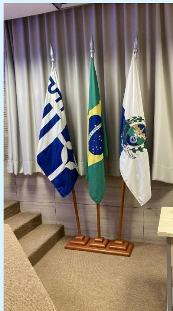
Colocação de mastros e bandeiras nos auditórios dos Blocos A e E, no aguardo de um conjunto de bandeiras para o auditório do Bloco C