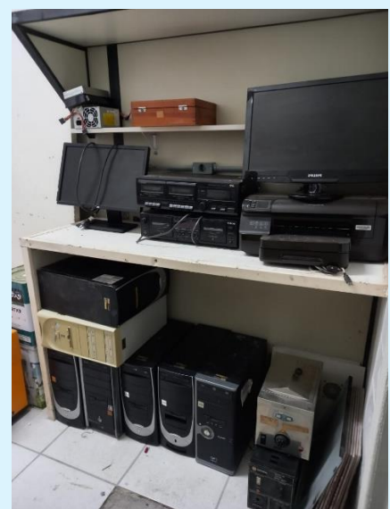
Materiais identificados aguardando retirada por processo de desfazimento