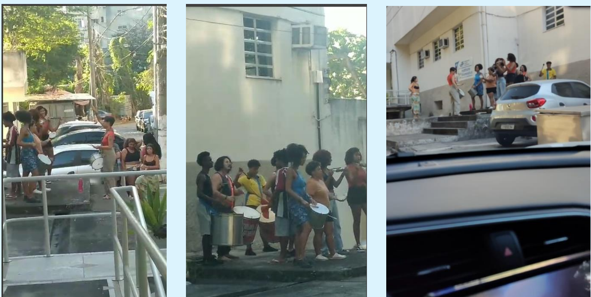
Flagrantes de ações do movimento estudantil no Instituto Biomédico – Bloco D