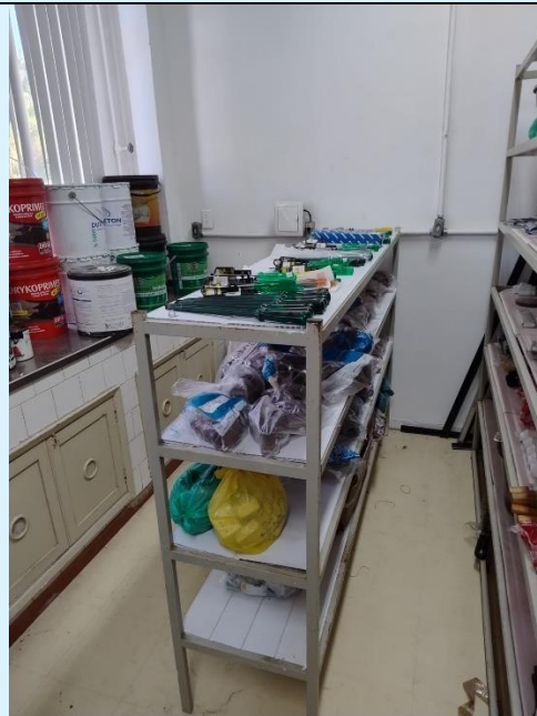
Organização do Depósito de insumos para Obras e serviços do Bloco A.