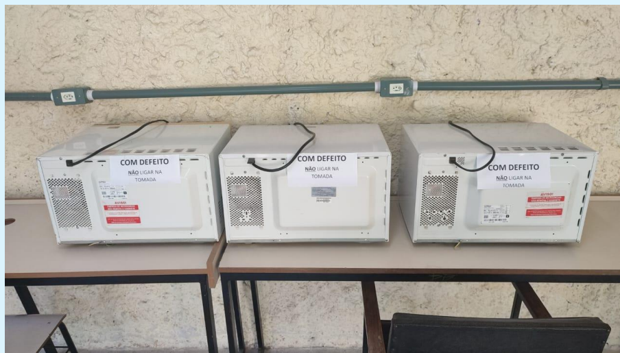
Microondas defeituosos aguardando troca de peças pela SOMA