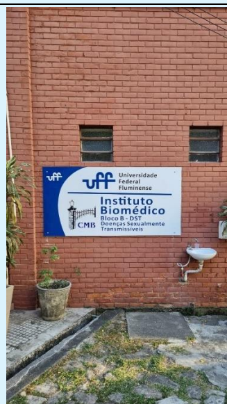
Identificação dos Blocos A e B do Instituto Biomédico pela SOMA