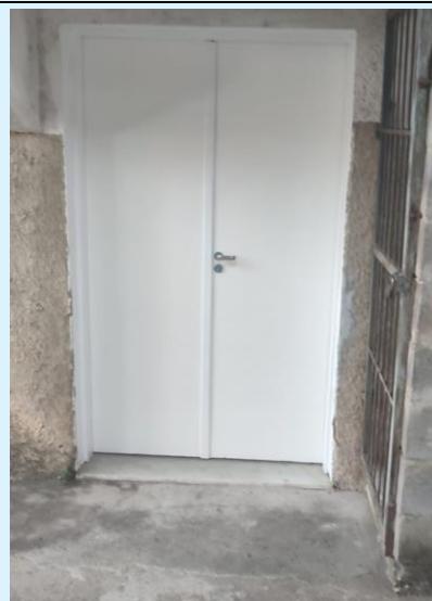
Em continuidade a troca e pintura de portas no Biomédico – No exemplo: acesso na área Anatomia Humana