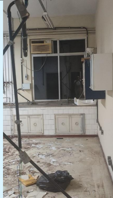
Preparo da Sala 304 do Bloco A para funcionamento do LABortatório e Bacteriomas Marinhos