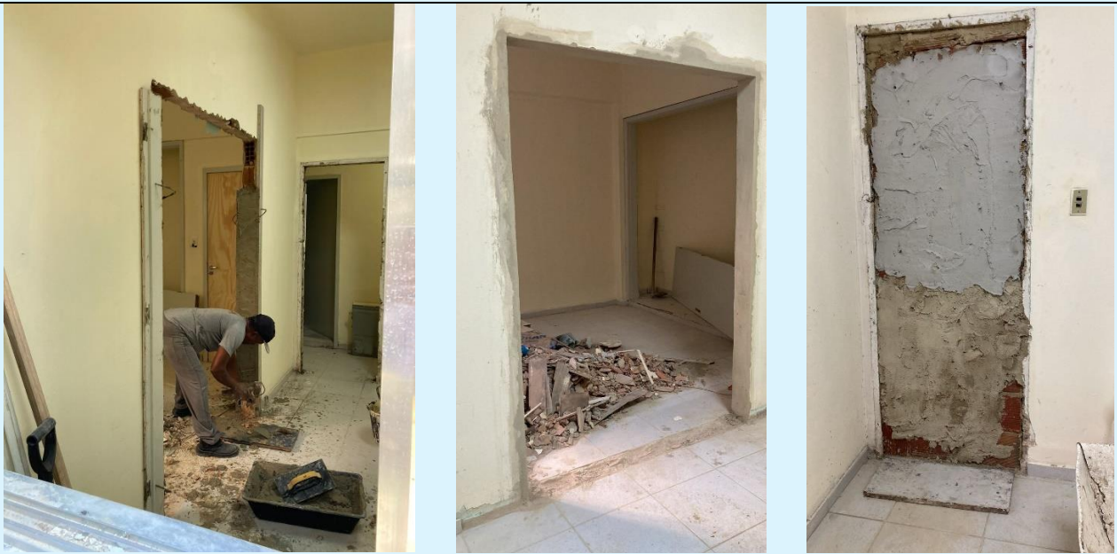
Flagrantes do andamento as obras de adequação do espaço destinado ao DAJUP e Atlélica