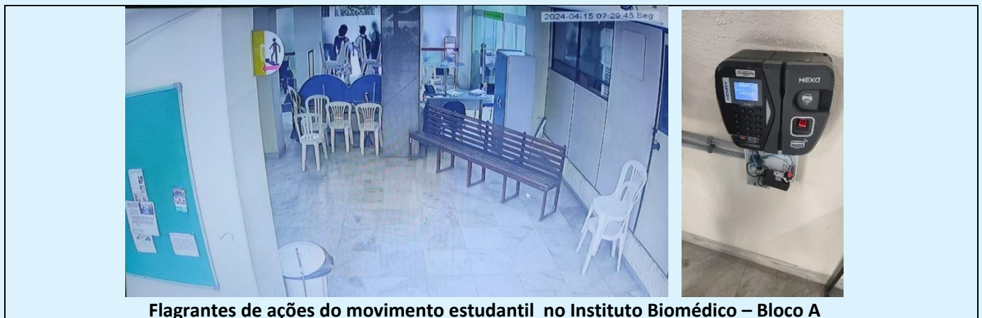
Flagrantes de ações do movimento estudantil no Instituto Biomédico – Bloco A