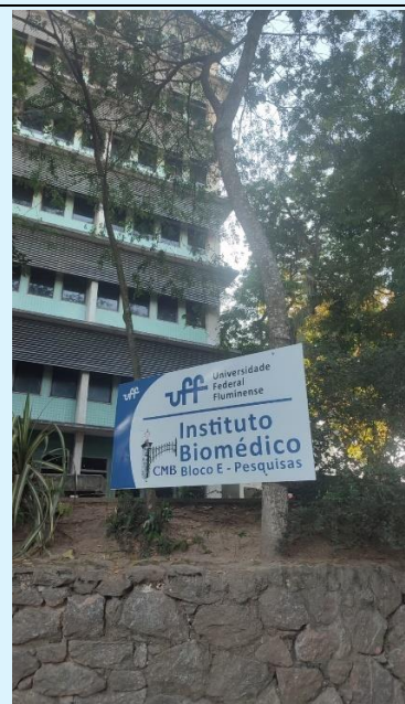
Identificação dos Blocos do Instituto Biomédico pela SOMA