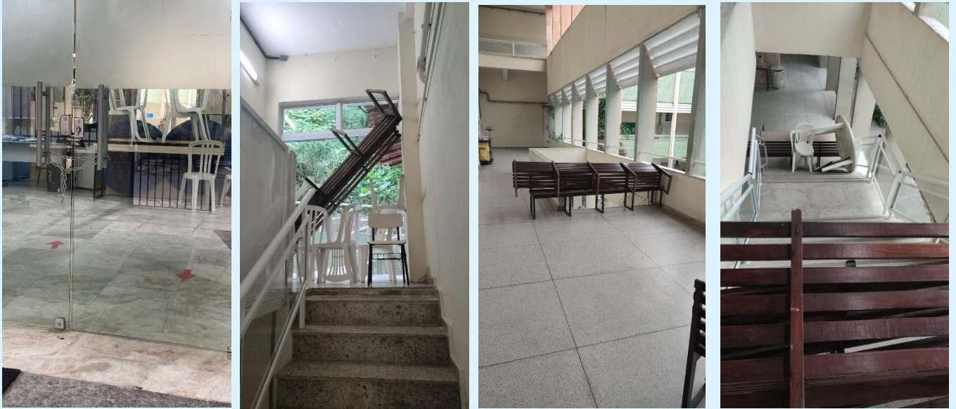
Flagrantes de ações do movimento estudantil no Instituto Biomédico – Bloco D