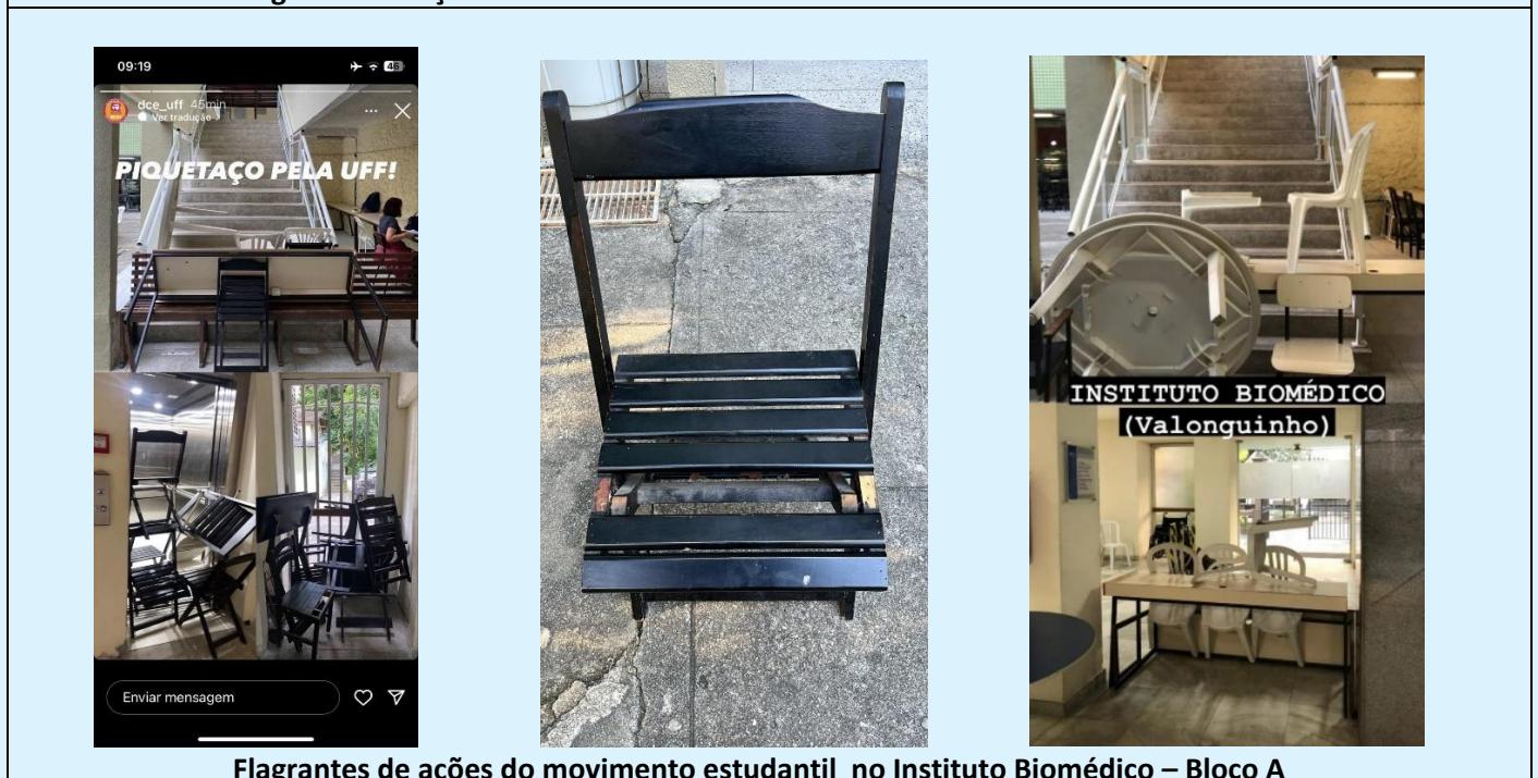
Flagrantes de ações do movimento estudantil no Instituto Biomédico – Bloco A