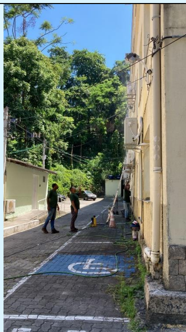
Manutenção corretiva e preventiva dos ares-condicionados (Blocos A,B,C,D) E?