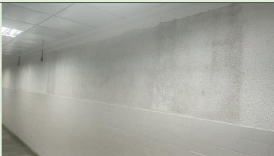
Solicitado pintura do corredor do térreo e segundo andar do Bloco E