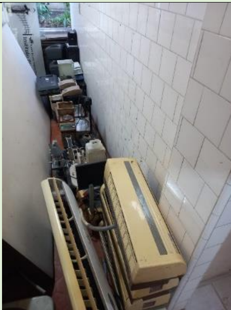
Iniciado novo processo de desfazimento de bens inservíveis na Unidade