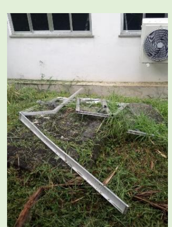
Danos nas persianas das salas de aulas por mau uso: solicitado maior cuidado por todos e comunicação à direção quando for observado.