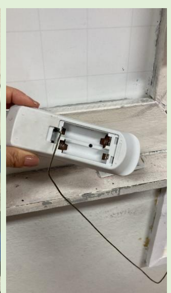
Danos em mobiliários e extravios de pilhas: solicitado que seja feita a comunicação à direção quando for observado.