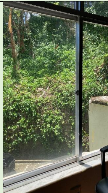
Reposição de vidros quebrados no Auditório do Bloco A na ocasião do temporal de 5/10/2023