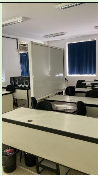
Pintura do corredor de acesso e interior do Laboratório Multimídias do MFL (Sala 207 –A, Bloco A)