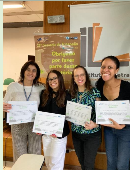
Participação na Cerimônia de Encerramento da Agenda Acadêmica. Congratulações aos premiados na semana acadêmica da UFF