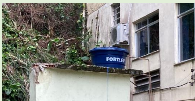
Recuperação do sistema de abastecimento d'água da Cantina após o temporal de quinta de 05/10/2023