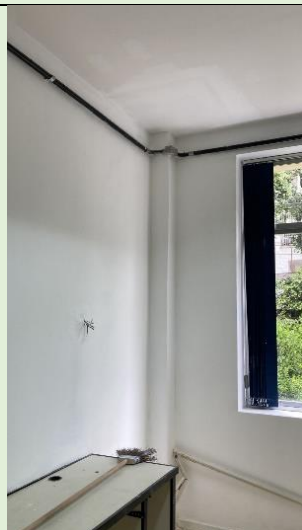
Sanada a infiltração do Laboratório Multimídia do MFL – Sala 207 A - Bloco A