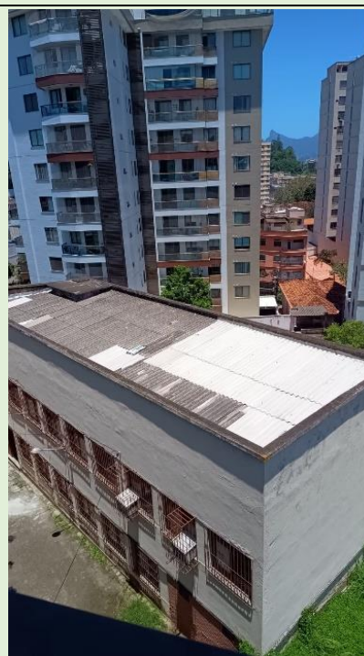
Danos no telhado do Bloco D (DST).