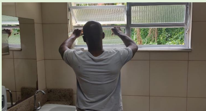
Reposição de vidros quebrados em banheiro do Bloco A na ocasião do temporal em 5/10/2023.