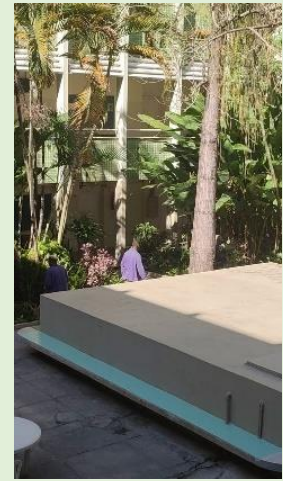
Serviço de Jardinagem no Pátio interno do Bloco A