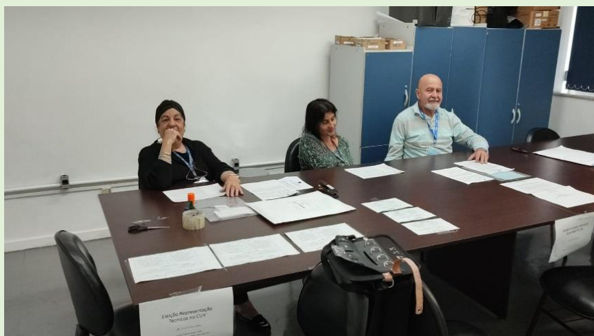
Mesa receptora de votos para Eleição de representantes dos TAEs no CUV