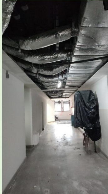
Prosseguimento a obra da troca do forro dos corredores e dos laboratórios