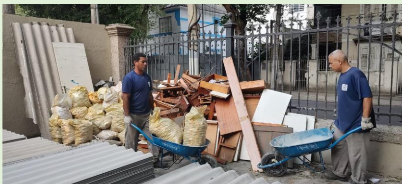
Retirada de entulho resultante de obras e reformas no Bloco A