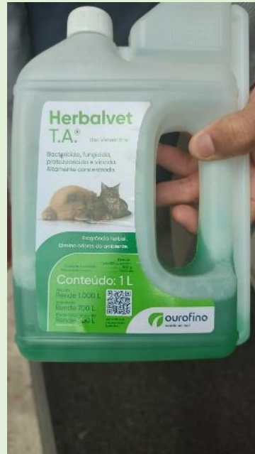
Aplicação de Quaternário de Amônio para redução de mofo nos Blocos A e E