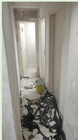
Em andamento reparo na infiltração da Antiga secretaria do MMO no Bloco A