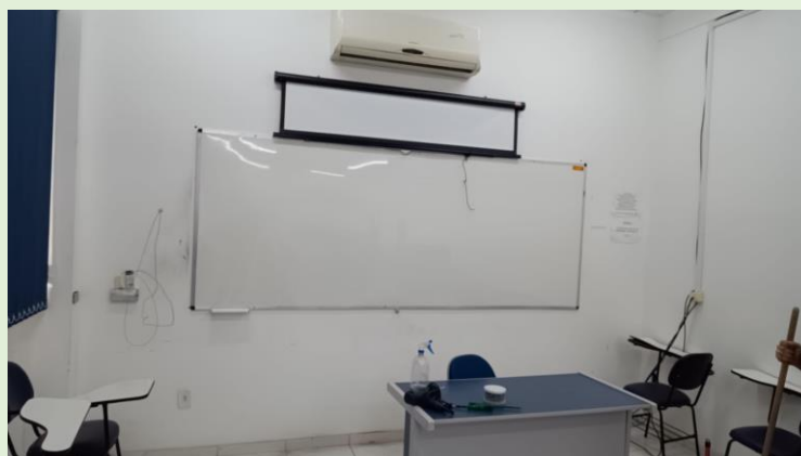
Instalação de novo quadro na sala 02 do Bloco C