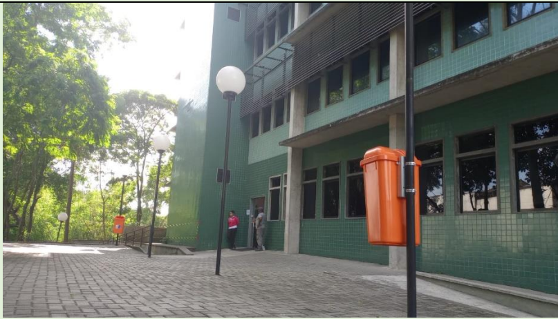
Instalação de lixeiras na área frontal do Bloco E