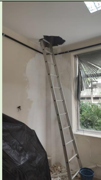
Em andamento reparo na infiltração da Sala Multimidia do MFL no Bloco A