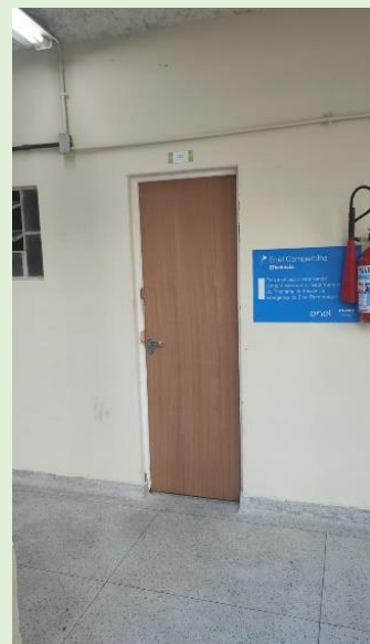
Instalação de portas no novo acesso à antiga casa do zelador, banheiro masculino e casa de bombas