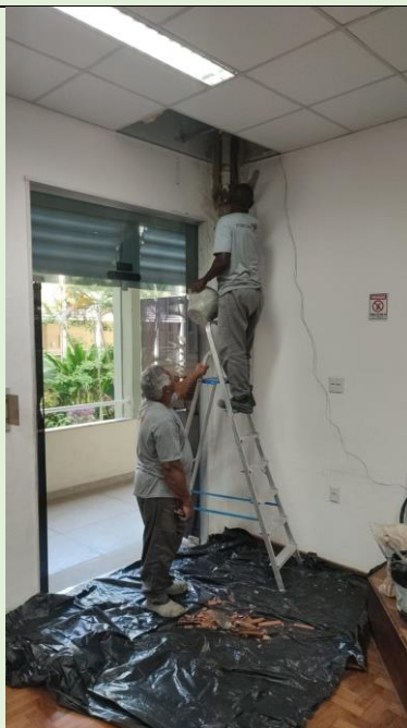
Sanada infiltração da coluna do Auditório do Bloco A