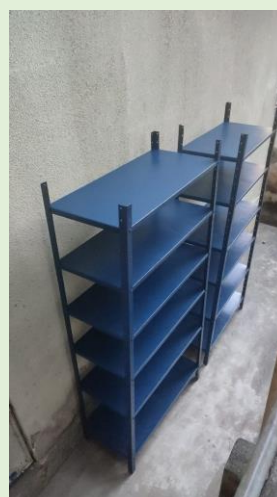
Pintura de estantes e destinação para apoio de mochilas no Anatômico