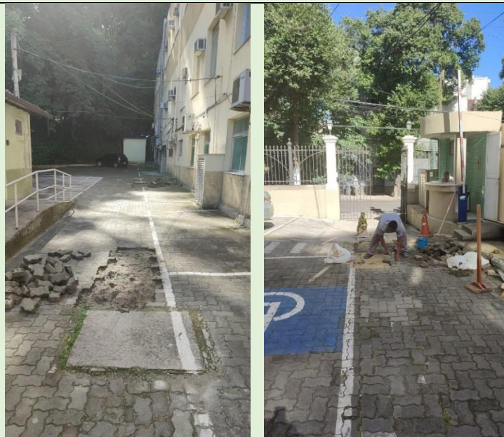
Recuperação do piso da entrada do Estacionamento do Bloco A