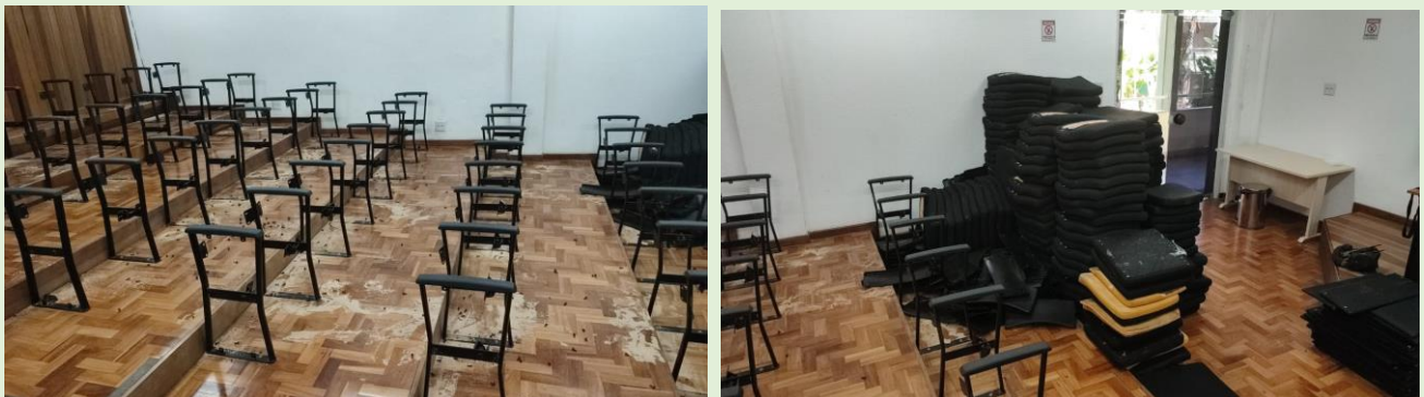
Feita retirada de encostos e assentos das poltronas do Auditório do Bloco A danificadas pelos cupins