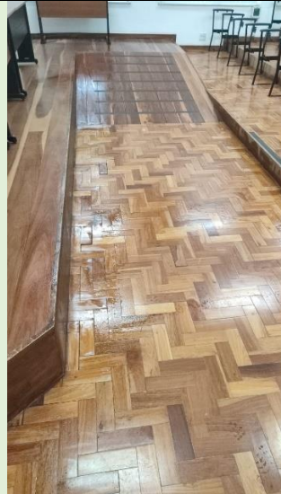
Feita a descupinização do Auditório do Bloco A , mas ainda não foi efetiva