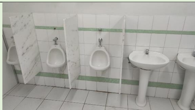
Concluída a Recuperação dos Banheiros e Gabinetes sanitários do Subsolo do Anatômico