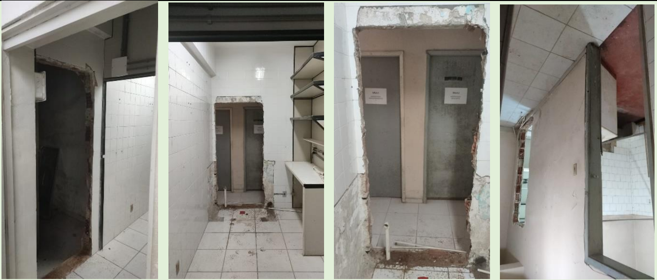
Abertura de portas de acesso à casa do Zelador

❑ Na forma de relatório fotográfico sobre ocorrências na Unidade foram apresentadas as fotos a seguir: