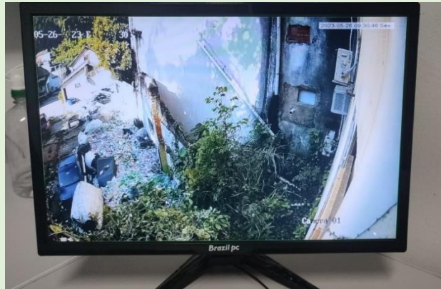
Corte dos galhos na área de fundos do Bloco A permitindo visão da Câmera de segurança do MONITORA-UFF