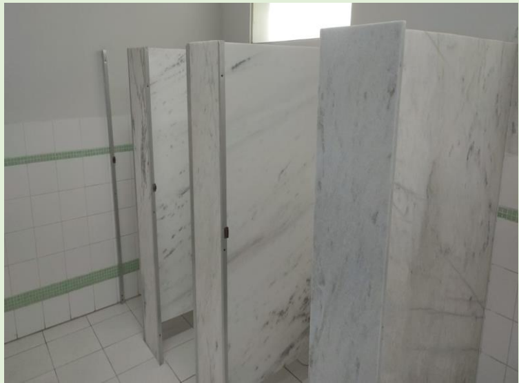
Em andamento reforma dos gabinetes sanitários do banheiro masculino do subsolo do Anatômico