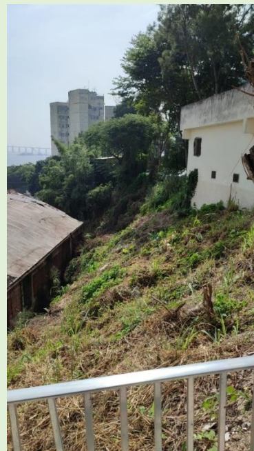
Roçada da vegetação no entorno Bloco C e do Anatômico