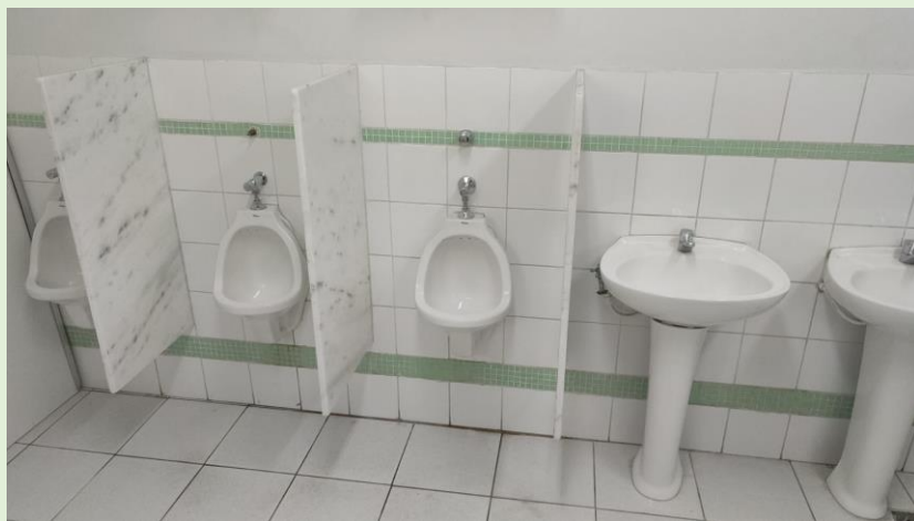
Concluídos os serviços em mictórios e pias do banheiro masculino do subsolo do Anatômico