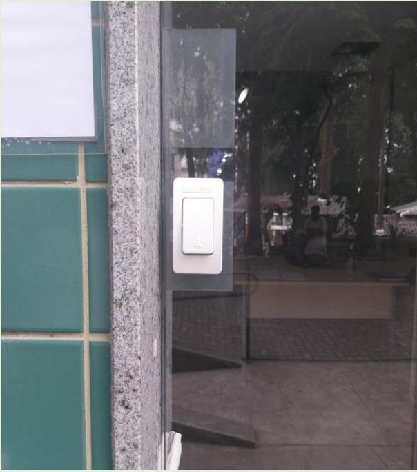
Instalação de campainha na porta do Bloco E