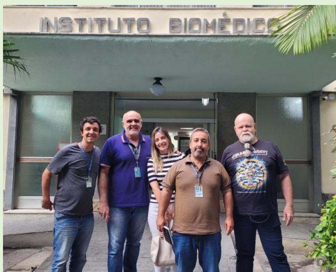
Flagrante da Visita da Comissão de Segurança Interna da Faculdade de Veterinária-UFF ocorrida em 12 de abril de 2023

Na forma de relatório fotográfico sobre ocorrências na Unidade foram apresentadas as fotos a seguir: