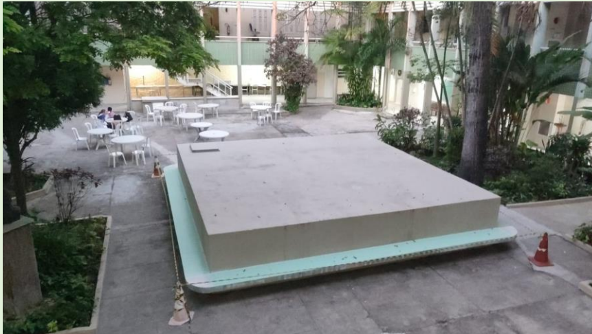
Impermeabilização do assento lateral da cisterna do Pátio Central do Bloco A