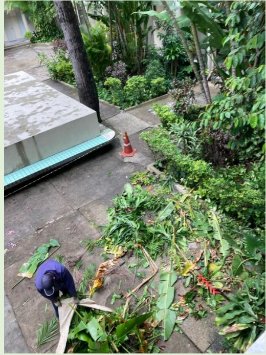
Poda das plantas do Pátio Central do Bloco A