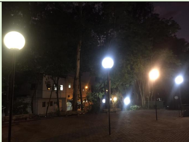
Recuperação das luminárias em frente ao Bloco E