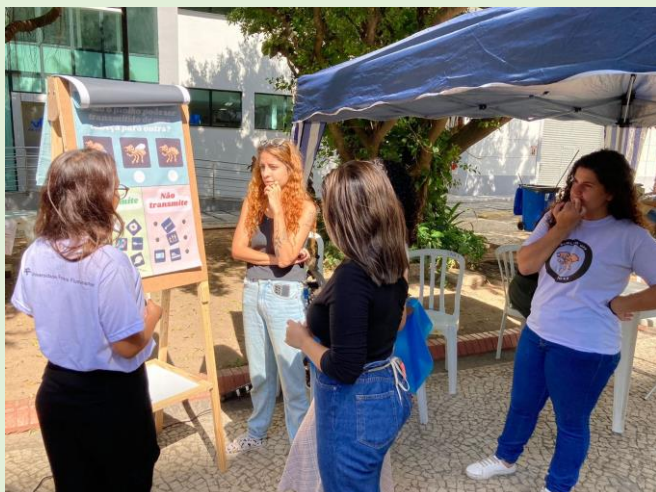
Participação das ações do Instituto Biomédico em Evento da Proex