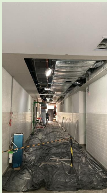
Em continuidade a substituição do forro em gesso dos tetos dos corredores do Bloco E.