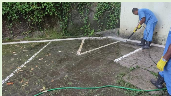
Remoção de limosidade do piso do estacionamento