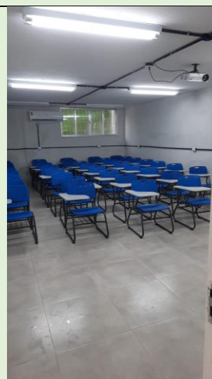
Finalização da obra de criação da sala 10 do Instituto Biomédico