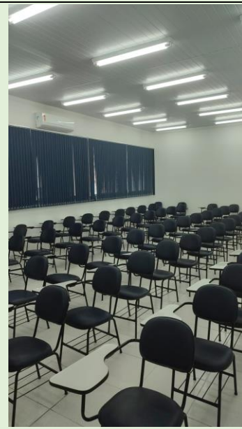
Finalização da obra de troca de piso das salas de aulas do 3º andar do Bloco C