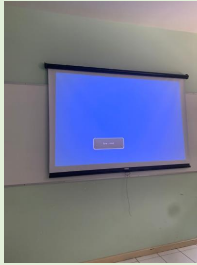
Reposicionamento do projetos multimídia e instalação de telas retráteis em todas as salas do Anatômico