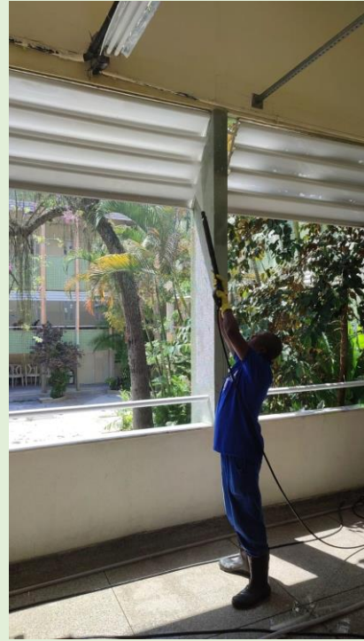
Mutirão de Limpeza Geral nos Blocos do CMB