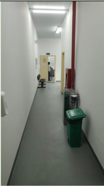
Finalização do obra de troca do piso do 3º Andar do Bloco C