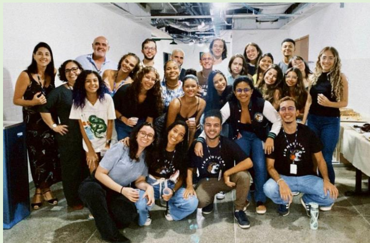
Acolhimento dos calouros do Curso de Biomedicina da UFF

Na forma de relatório fotográfico sobre ocorrências na Unidade foram apresentadas as fotos a seguir: