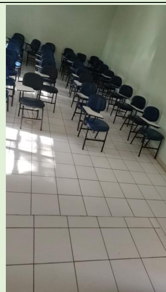
Finalização da obra de troca de piso de corredores e salas de aulas do Anatômico