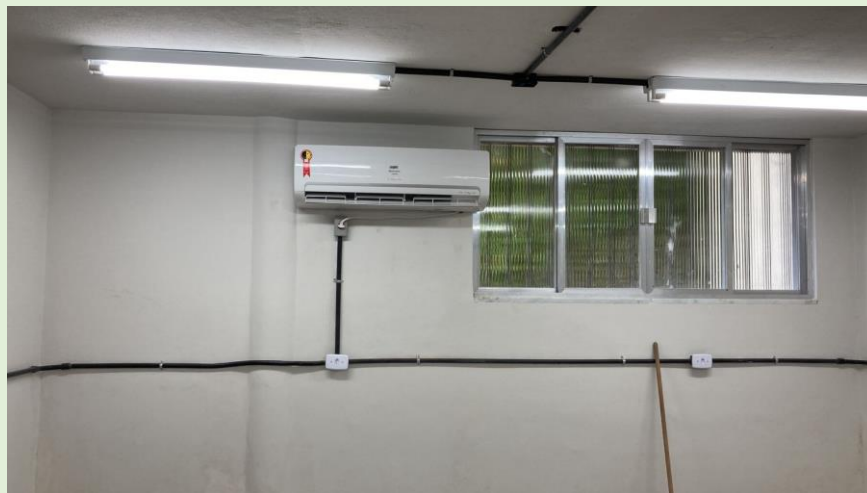
Instalação dos novos aparelhos de ar-condicionado Salas de aulas 2 , 9 e 10, Laboratórios de ensino A e B, sala do Rack/STI na direção