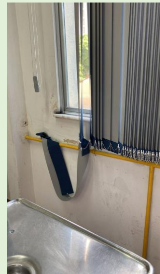
Danos nas cortinas trocadas recentemente (A direção solicita cuidado dos servidores e orientação dos alunos)