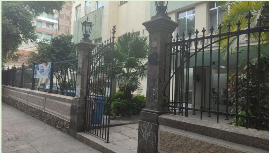
Vandalismo por pichadores no muro externo do Instituto Biomédico – Feita solicitação à SOMA.