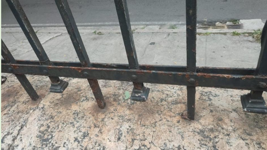
Sinais visíveis de corrosão nas grades do muro externo do Instituto Biomédico – Feita solicitação à SOMA.