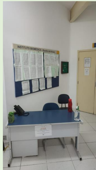
Pintura das paredes da recepção, corredores e escadaria do Bloco C