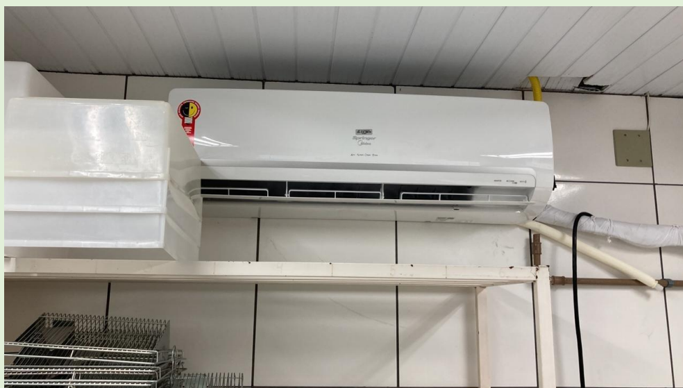
Instalação emergencial de ar condicionado no biotério (sala 208) do Bloco A PROAD/PROEX/SOMA