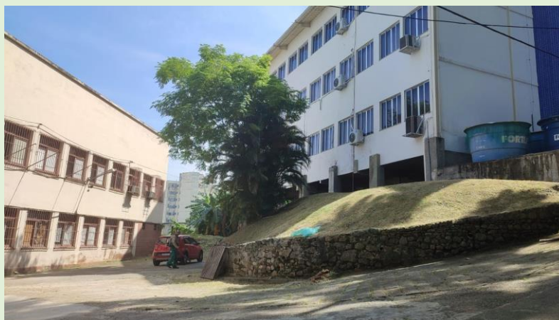
Capina das áreas externas dos Blocos B, C e D. SOMA/RIZOMA