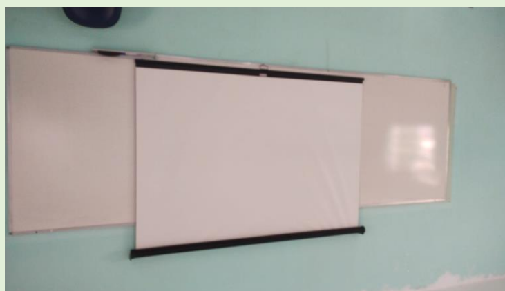
Instalação de telas de projeção retráteis nas salas A e B do Anatômico Apoio: CMB/Zelador/SPECTRU