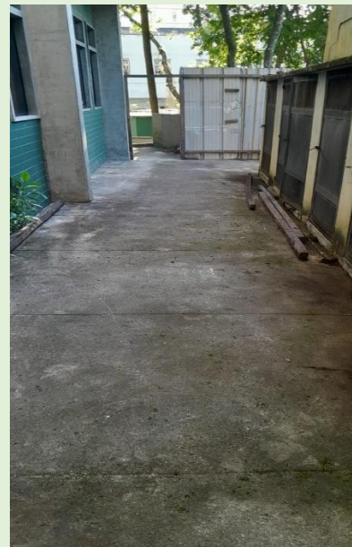
Limpeza do corredor lateral esquerdo do Bloco E SOMA/SOLL