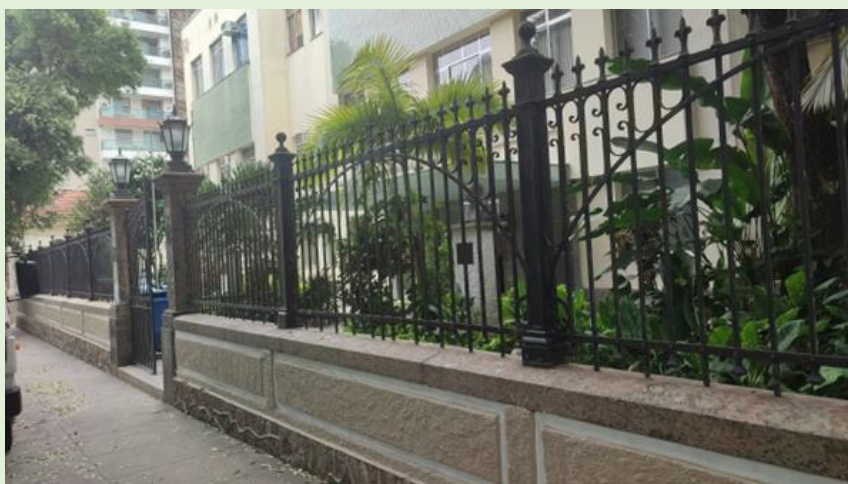
Pintura do muro frontal do Bloco A SOMA/VIVACOM