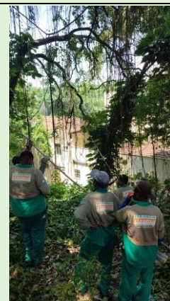
Corte de grande parte da Árvore que coloca em risco a Área de Convivência do Bloco A SOMA/RIZOMA