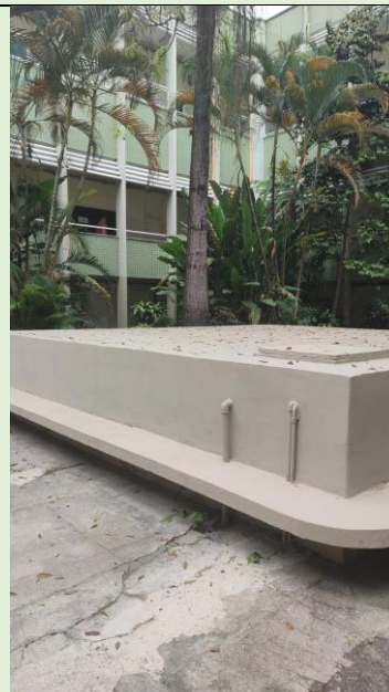
Pintura da cisterna do Pátio interno do Bloco A SOMA/VIVACOM