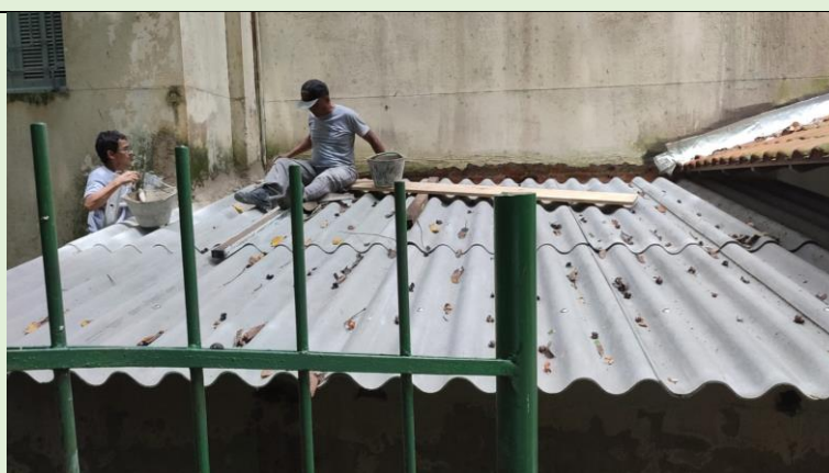
Substituição do telhado sobre os banheiros da Antiga Secretaria do MMO no Bloco A SOMA/VIVACOM