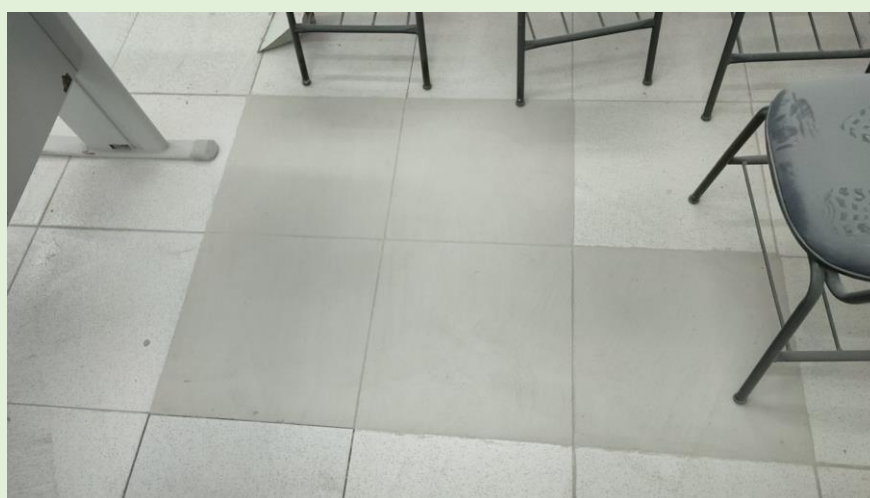
Remoção e substituição do piso solto no 3º andar do Bloco C SOMA/VIVACOM