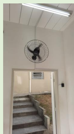
Instalação de Ventiladores no Subsolo do Anatômico e portaria do Bloco C. Apoio: PROAD/PROPLAN