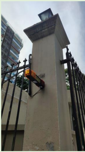
Instalação de sinaleira na saída do Estacionamento do Bloco A – SOMA