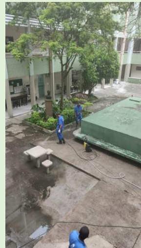
Lavagem do piso do pátio e áreas externas do Bloco A com máquina lava-a-jato – SOLL