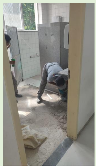
Remoção do piso solto e substituição por piso em cimento liso no 3º andar do Bloco C.