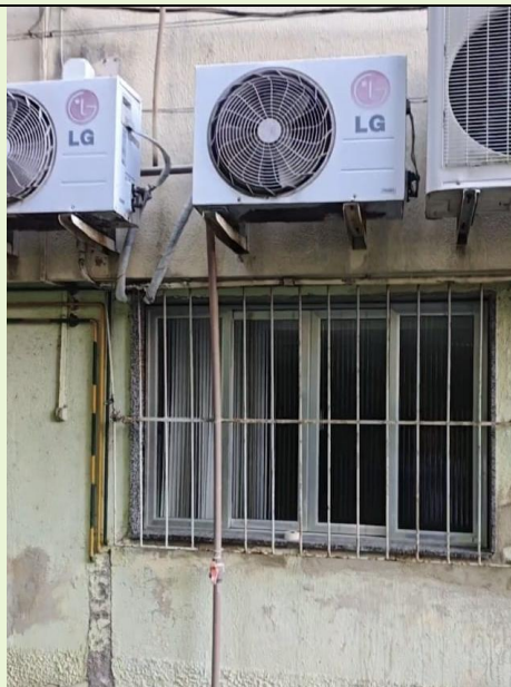
Situação de gravidade dos suportes dos equipamentos de Ar-condicionado da Unidade 20 pedidos em aberto aguardando atendimento da SOMA