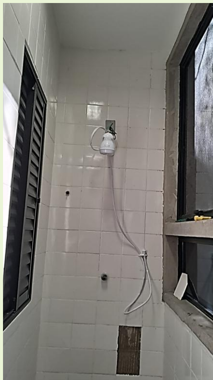
Permanecem os lamentáveis problemas de roubo de chuveiros no Bloco E