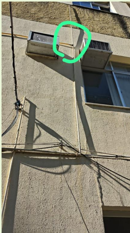
Solucionado vazamento em tubulação externa de gás com recursos da Unidade

OBS* Em caso respeito a LGPD, qualquer pessoa identificada nas imagens poderá solicitar a sua remoção.