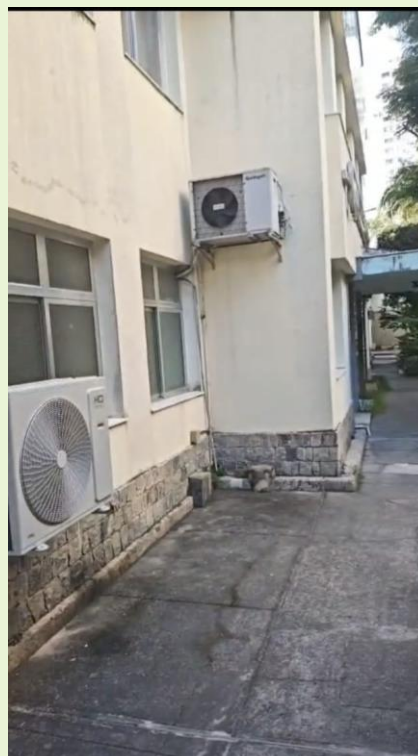
Instalação inadequada de equipamento de ar condicionado na Biblioteca em área de Passagem já solucionado