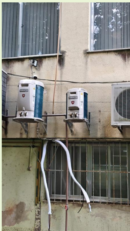
Instalação inadequada de equipamento de ar condicionado na Biblioteca em área de Passagem já solucionado