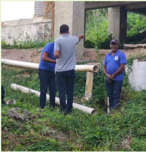
Resolvido problema de tubulação rompida na parte externa do Bloco C