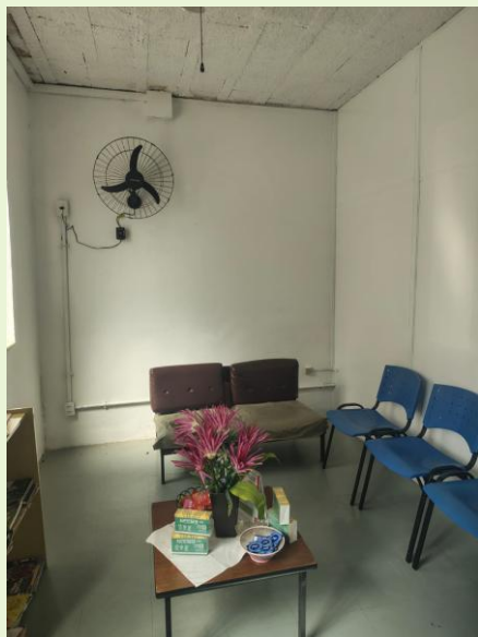
Instalação e disponibilização de ventiladores na recepção e espera no DST